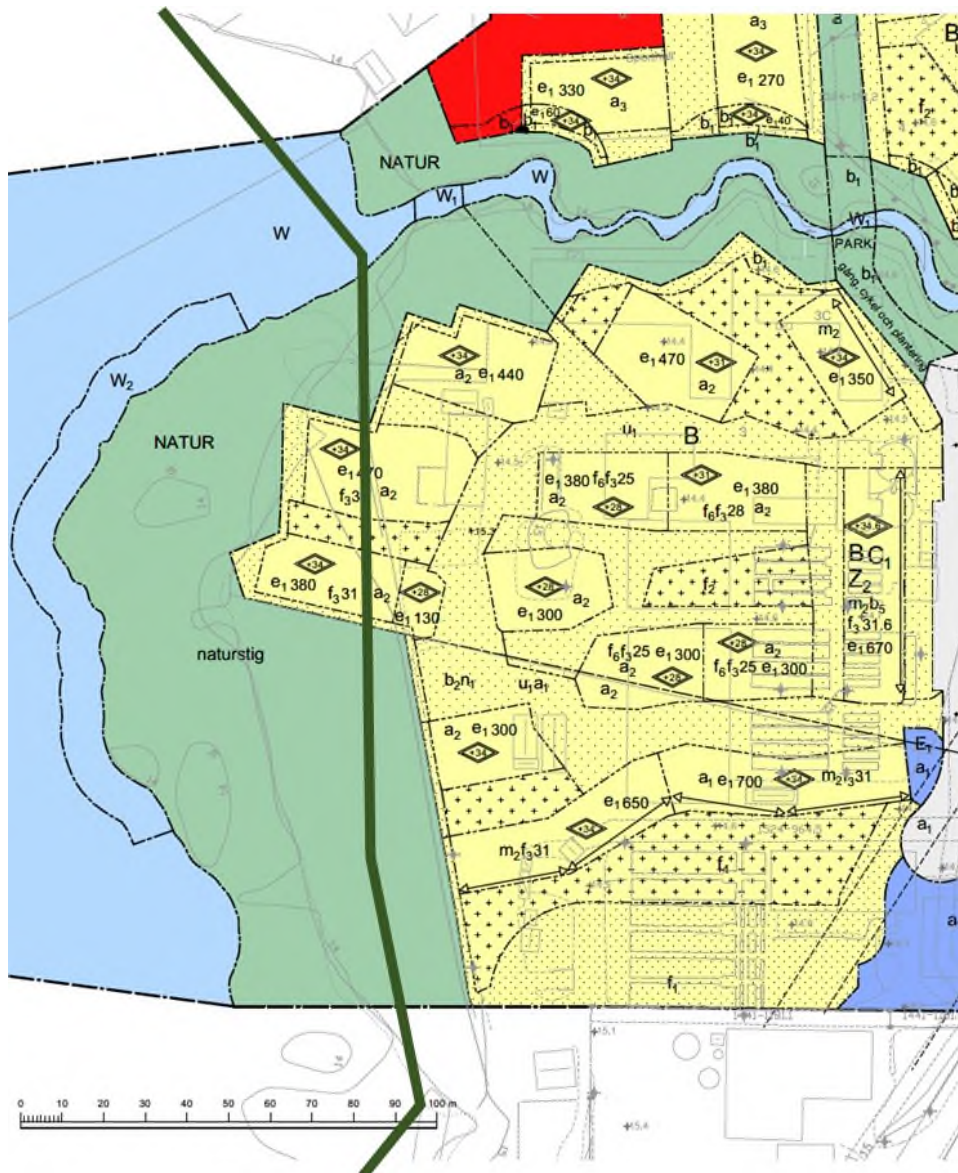
Figur 2. Detaljplaneförslaget med gränslinjen för riksintresset för naturvård överförd från Naturvårdsverkets karta "Skyddad natur".

LNF hävdar bestämt att eventuell bebyggelse inte ska få ske inom riksintresseområdet och därmed skada strandzonen med dess bård av alsumpskog med höga naturvärden. Skadan skulle bland annat manifesteras av habitatsförlust för den mycket skyddsvärda mindre hackspetten. Föreslagna bebyggelse inom riksintresseområdet är därför oacceptabel.