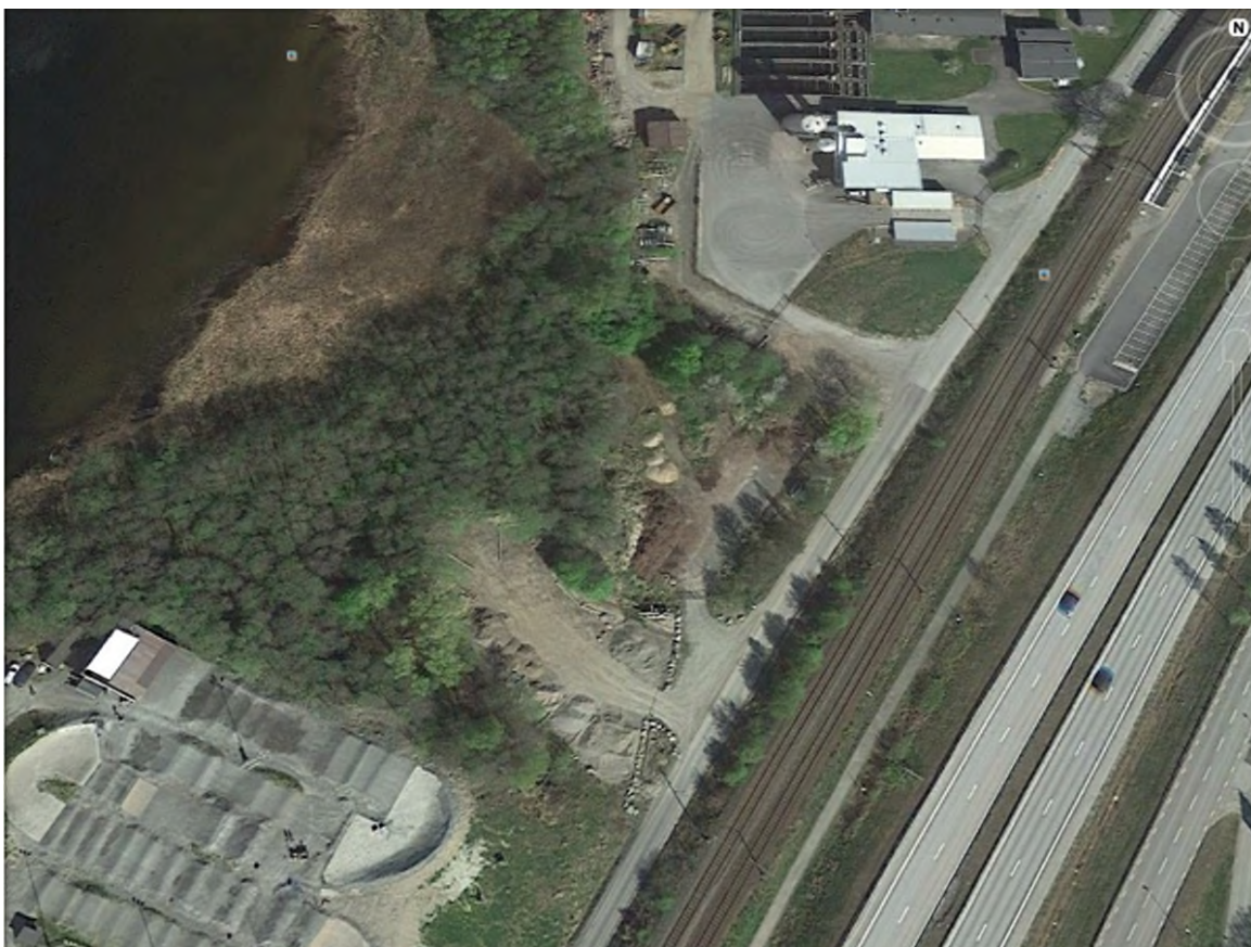
Figur 3. Upplagsområdet mellan värmecentralen och BMX-banan.

Det är ofrånkomligt att etablerandet av bebyggelse enligt detaljplaneförslaget påtagligt ändrar förhållandena i planområdet och dess närmaste omgivningar. Boende inom planområdet kommer att ha tillgång till ett närbeläget rekreationsområde närmast söderut bestående av Lessudden och koloniområdet. Men området mellan den nya bebyggelsen och Lessudden är oattraktivt med värmecentralen, ett upplagsområde och BMX-banan. Intrycket av detta mellanområde skulle förbättras om åtminstone upplagsverksamheten avvecklas och strandskogen rehabiliteras, där intrång har skett i denna. Rehabilitering underlättar även att förlänga naturstigen fram till Lessudden. Upplagsområdets omfattning framgår tydligt på flygbilden, figur 3 .