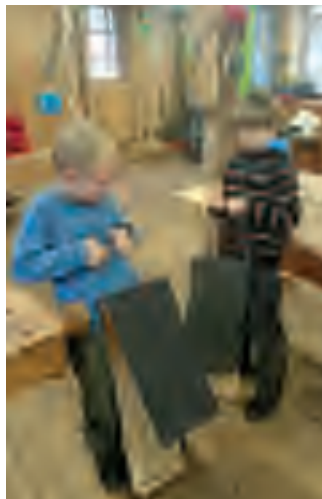
Snokar på holkverkstaden