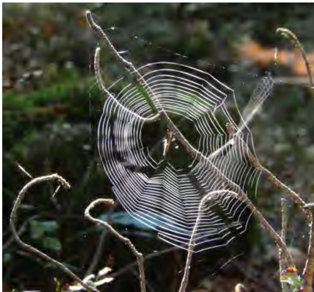
Spindelväv i Risveden

Besök vår hemsida http://lerum.naturskyddsforeningen.se