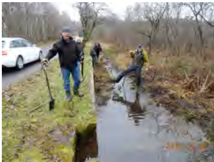
Text och Bild: Stefan Larsson

Det kan tilläggas att grodtunnelanläggningarna på Nääs-Öijared var att beteckna som ett pionjärarbete med lyckat resultat och som fått många efterföljare i landet.