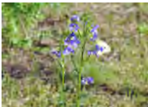
Blågull med kålfjäril

Välkommen att besöka ängen. Den ligger på Lingonvägen i Uddared, Floda utefter Uddaredsvägen. Jag räknar med ytterligare några år innan jag blir färdig, men välkommen redan i år. Då kan jag visa hur ängen ser ut nu men även ge fler tips om hur man anlägger en äng eller odlar ängsblommor.