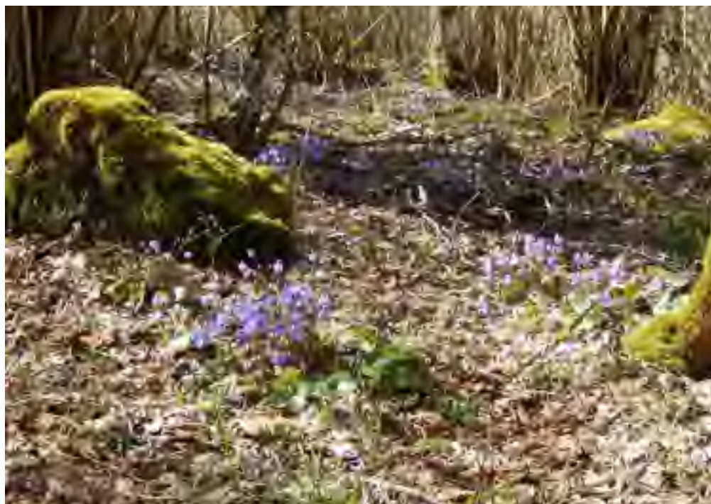
Blåsippor vid Ålleberg