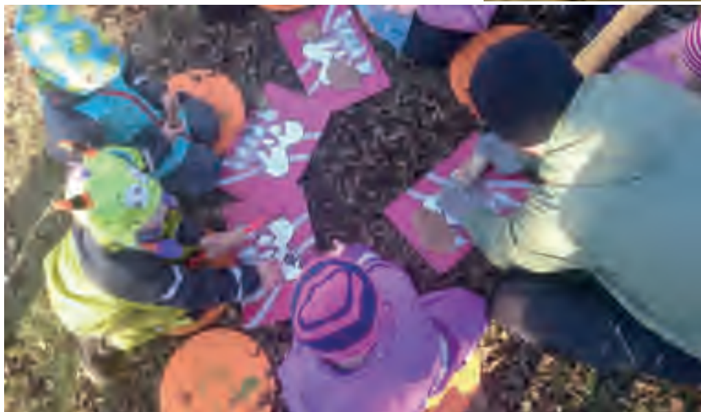
Snokar bakar pepparkakor till jul