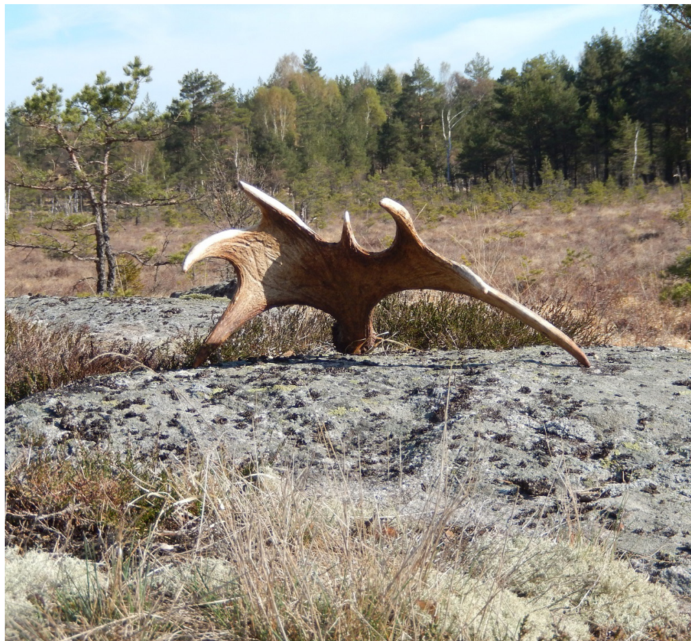
14-taggare Vite mosse.

Besök vår hemsida http://lerum.naturskyddsforeningen.se