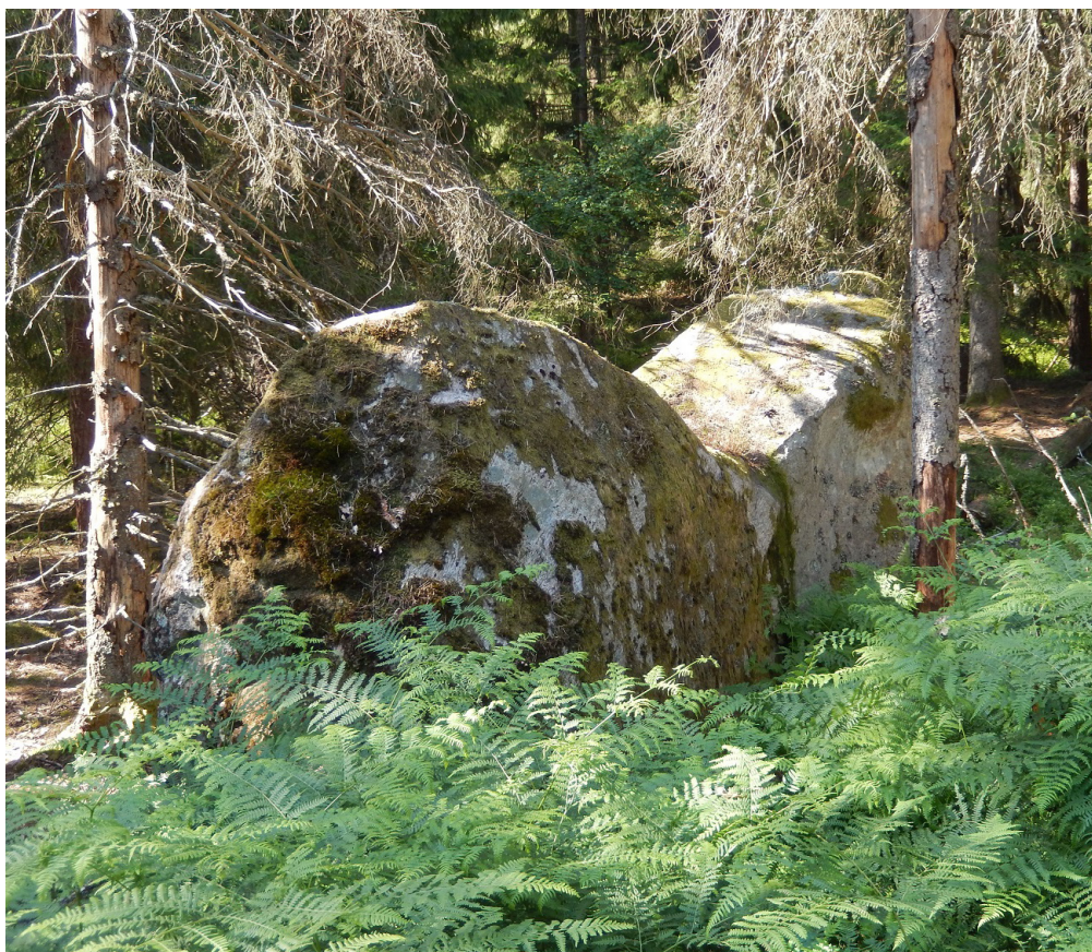
Saltstenen i Risveden.

Olov Holmstrand, ordförande i Lerums Naturskyddsförening