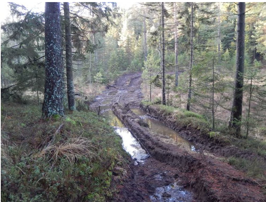
Körskada i nordkanten av det avverkningsanmälda området 2019-12-22.

Det bör särskilt framhållas att påtagliga delar av det avverkningsanmälda området utgörs av fuktiga svackor eller i de södra delarna sumpskog. Sådan skog kan inte avverkas utan mycket svåra markskador och bör därför lämnas orörd.