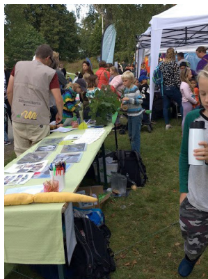
Barnfestival på Näås