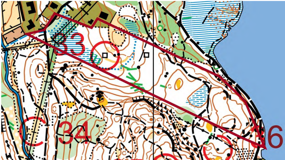
Det avverkningsanmälda området inlagt på uppförstoring av kartan för orientering (Naturpasset). De gröna strecken markerar död ved.

det finns även en hel del björk och andra lövträd, exempelvis enstaka ekar. I branten utmed Stamsjön finns tallar med högre ålder, eftersom remsan närmast sjön inte var avverkad 1975. I västra delen finns några påtagliga ansamlingar av död ved. Se nedanstående orienteringskarta och nytaget foto.