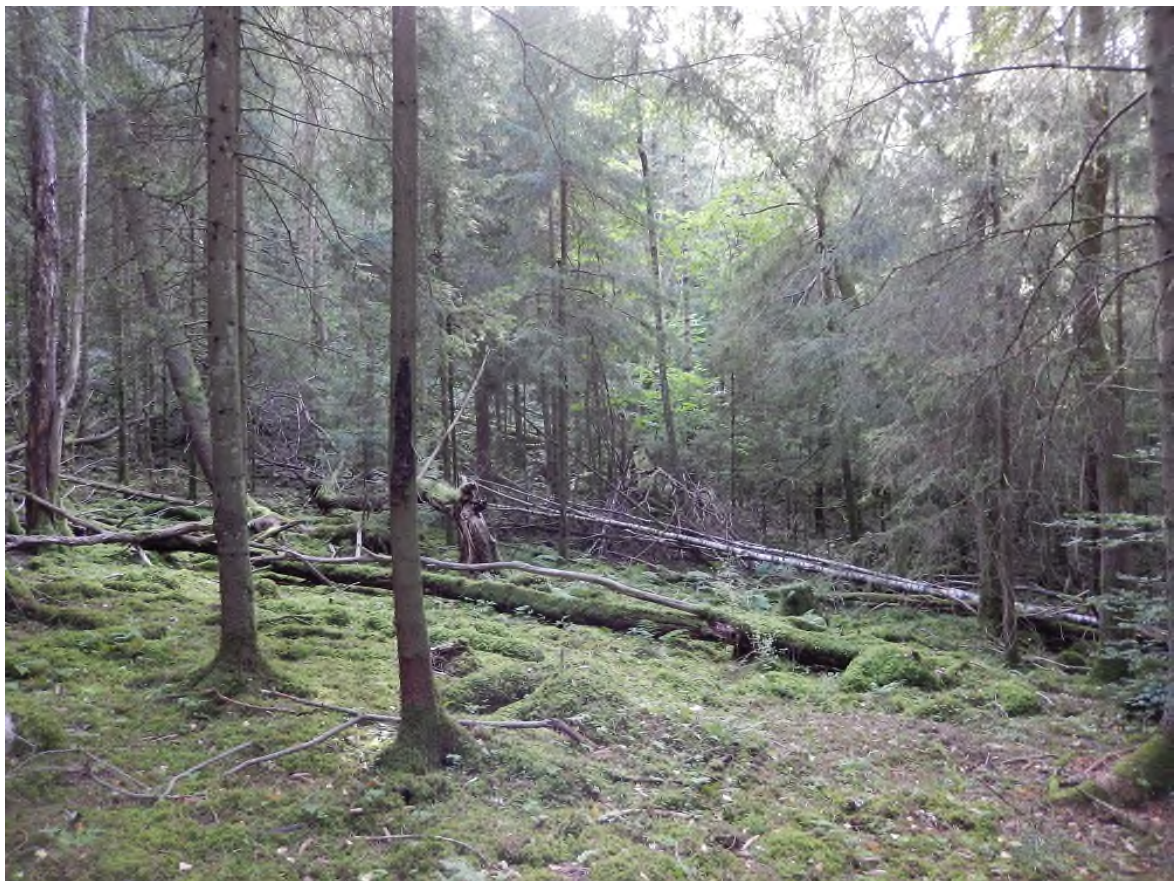
Död ved i nordvästra delen av området 2020-09-17.