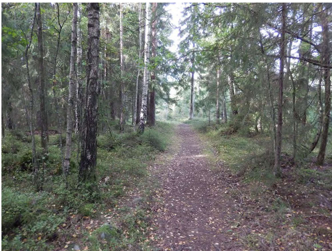
Gångvägen genom området med representativ vegetation 2020-09-17.

Längs Stamsjön går en iordninggjord och markerad vandringsled som är välfrekventerad. Där leden inte går på körvägar har stigarna grusats för att bli lättframkomliga och övervägande torra. Genom mellersta delen av det avverkningsanmälda området går en bred och välanvänd gångväg med fortsättning söderut och som funnits under mycket lång tid. Dessutom finns mindre upptrampade stigar i området.