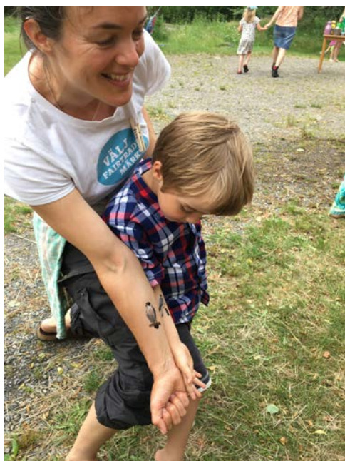
Pilgrimsfalken och Stenfalken avklarade.