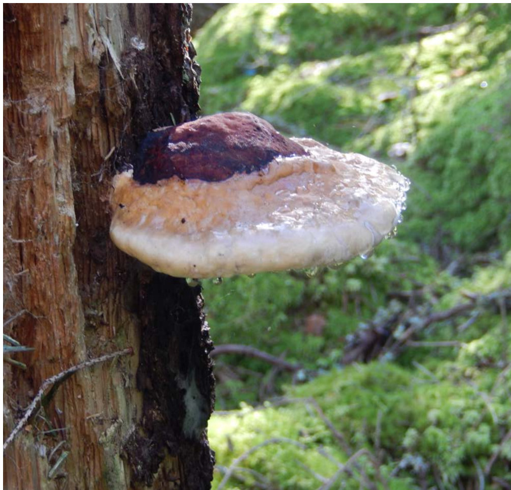
Dropticka på död ved i Risveden.

Besök vår hemsida http://lerum.naturskyddsforeningen.se