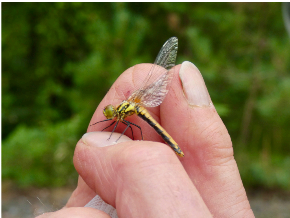
Svart Ängstrollslända

Avsändare: Olov Holmstrand Torphagebacken 11 443 38 LERUM