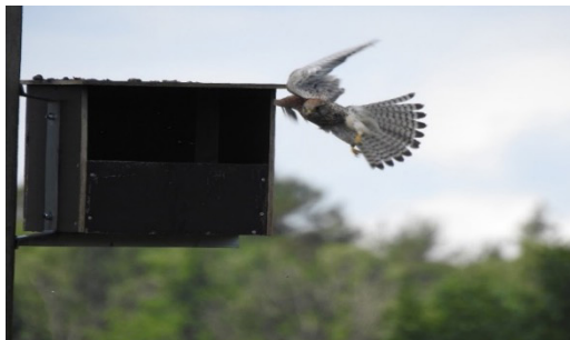
Vuxen tornfalk landar i holken.

Toppåret under hela projektet blev 2001 då hela 55 ungar märktes. I samband med detta värvades Elin Eriksson-Byröd till projektet. Hon är en fena på att klättra och helt orädd för höjderna. Totalt under dessa år har 662 tornfalkungar ringmärkts. Det är en fantastisk upplevelse att få hantera dessa små liv.