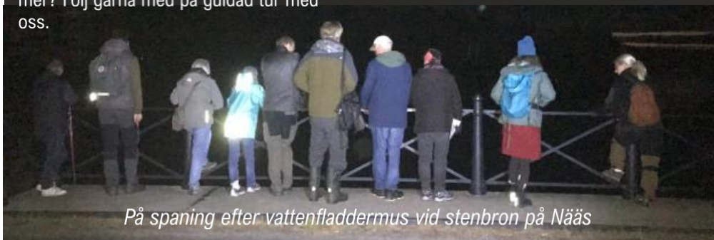
På spaning efter vattenfladdermus vid stenbron på Nääs